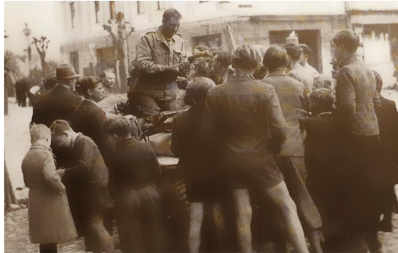
Die amerikanischen Soldaten waren schnell von Jugendlichen umringt, die heiß auf Kaugummi und Schokolade waren.

Vor nunmehr 75 Jahren, am 4. Mai 1945, um 13 Uhr, war in Oberndorf der Zweite Weltkrieg beendet. Die lokalen Parteigänger waren in den letzten Tagen nach Salzburg geflüchtet und es konnte in Oberndorf der Krieg unblutig beendet werden, obwohl bis zur letzten Stunde unklar war, ob dies ohne der von den Nazis vorbereiteten Sprengung der Salzachbrücke erfolgen könnte. Eine Sprengung beider Brückenpfeiler hätte sicherlich große Schäden an Häusern in Oberndorf verursacht. Sowohl in Oberndorf als auch in Laufen, wo sich der zweite verminnte Brückenpfeiler noch näher an den Häusern steht, fanden sich beherzte Männer, vor allem Bürgermeister und der „Volkssturm“, eine Gruppierung von Jugendlichen und alten „wehrunfähigen“ Männern, die dies verhinderten. NS-Ortsgruppenleiter und Sprengkommando waren für eine Sprengung. Ein SS-Oberleutnant aus Oberndorf kündigte an, er werde die Brückensprengung selbst mit einer Handgranate auslösen. Daraufhin eilten beherzte Männer aus Laufen mit einer weißen Fahne den Amerikanern entgegen und erreichten, dass