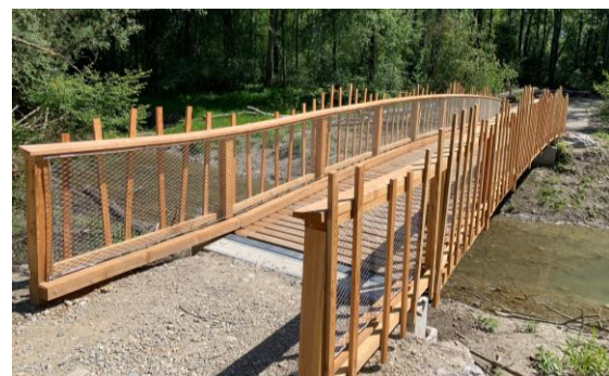
Der neue Reitbachsteg. Die Gestaltung zieht sich durch sämtliche Infrastrukturelemente des LIFE-Projekts Salzachauen

Ein großer Dank gilt Oberndorfer Bürgern, welchen es gemeinsam mit der Stadtgemeinde in Verhandlungen mit dem Land gelungen ist, eine Weiterführung des Weges nach dem Oichtenspitzen in die Au über einen extra zu errichtenden Steg über den Reitbach zu realisieren. Genießen wir dieses neue Naherholungserlebnis.