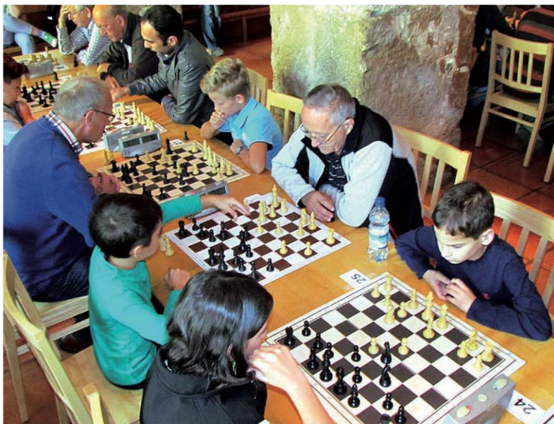
Im Schach können sich die Sportler jeden Alters messen.

Klubabend: Jeden Freitag ab 20 Uhr im Bauernbräu, Schüler- und Jugendtraining jeden Freitag 16 bis 18 Uhr, Gruppenraum der NMS Oberndorf, links neben dem Eingang.