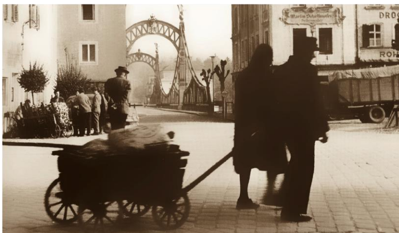
Der Krieg löste eine unübersehbare Flüchtlingswelle aus.