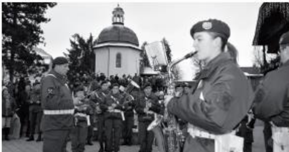
Die Militärmusikkapelle Salzburg, die sich wieder als starker Klangkörper in repräsentativer Größe zeigen kann, gastierte im Advent am Stille-Nacht-Platz zu einem vielbeachteten Friedenskonzert.