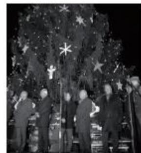
Der Weihnachtsbaum des Salzburger Christkindlmarktes kam aus Oberndorf. Viele Institutionen zeigten bei der Eröffnung Präsenz.