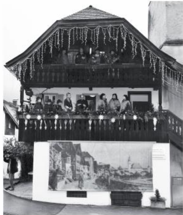
Im Nachmittagsprogramm: Schiffertheater mit Auszügen aus dem Stille-Nacht-Historienspiel 2018 bei der Spielstätte Wasserturmhäuschen.