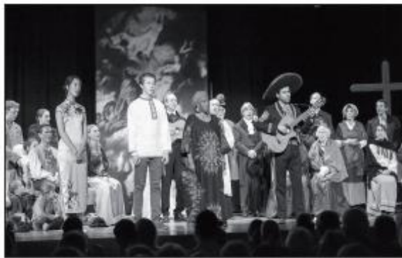
Bei den Historienspielen wurde „Stille Nacht!“ in Sprachen aus allen Erdteilen gesungen.

Diese Produktion wird auch im Advent 2019 gezeigt werden. Der Themenweg wird weiterhin so wie bisher in die Zeit von 1818 einführen.