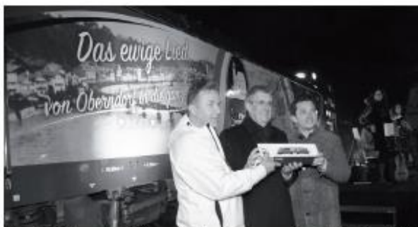
Die Salzburger Eisenbahn Transportlogistik GmbH stellte vor Weihnachten feierlich ihre 15. Hochleistungs-E-Lok vom Typ ‚Siemens Vectron‘ vor. Das Design ist „200 Jahre „Stille Nacht“ gewidmet.