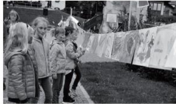
Der Kinder-Malbewerb zum Thema Stille Nacht und Frieden begeisterte die Jugend.