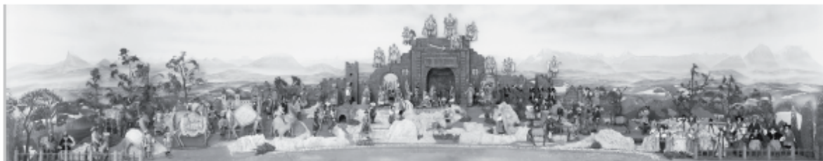
Die große historische Oberndorfer Stille-Nacht-Krippe wurde kürzlich restauriert und ist im Innviertler Volkskundehaus in Ried im Innkreis ausgestellt. Im Bildhintergrund ist die Gebirgssilhouette zu erkennen, die man von Oberndorf aus wahrnimmt.

Die künftige Präsentation, die der Krippe wesentlich mehr Platz bietet, erfolgt in einer nach oben hin geschlossenen Vitrine mit objektschonender Beleuchtung, unter entsprechenden klimatischen Bedingungen.