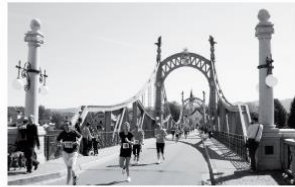
Der Friedens-Inklusionslauf war ein großartiges sportliches Ereignis mit vielen Teilnehmern.