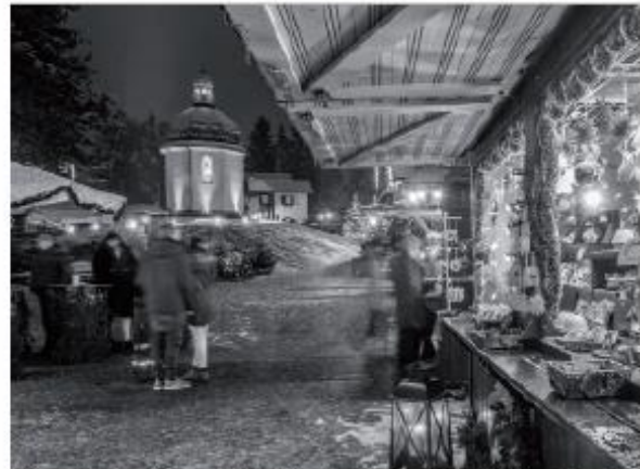
Gerade im Advent ist ein Besuch des Stille-Nacht-Bezirkes für die Gäste und natürlich auch für die Oberndorfer und Oberndorferinnen einen Spaziergang und ein schönes Erlebnis wert.

nachtsmarkt gestaltet, der viel Beachtung fand. Die Verschönerung und die Erweiterung des Geländes vor dem Museum und auf dem Leopold-Kohr-Platz beim Museum hat viel Zuspruch gefunden, um ausgedehnt am Weihnachtsmarkt bummeln zu können. Auch die Stände selbst und die Lichtgestaltung erfuhren eine Neuerung, die den Markt einzigartig machen.