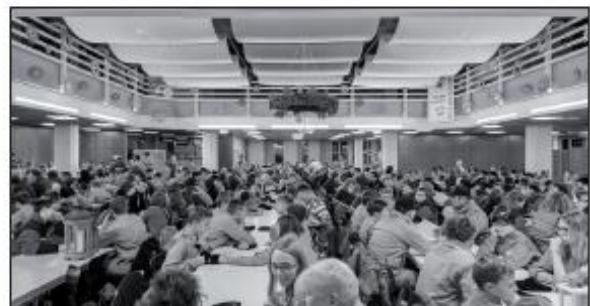
Die Flachgauer Feuerwehrjugend traf sich kurz vor dem Heiligen Abend in der Neuen Mittelschule. Es wurde an die einzelnen Feuerwehren vom „Friedensort Oberndorf“ aus das Friedenslicht verteilt.