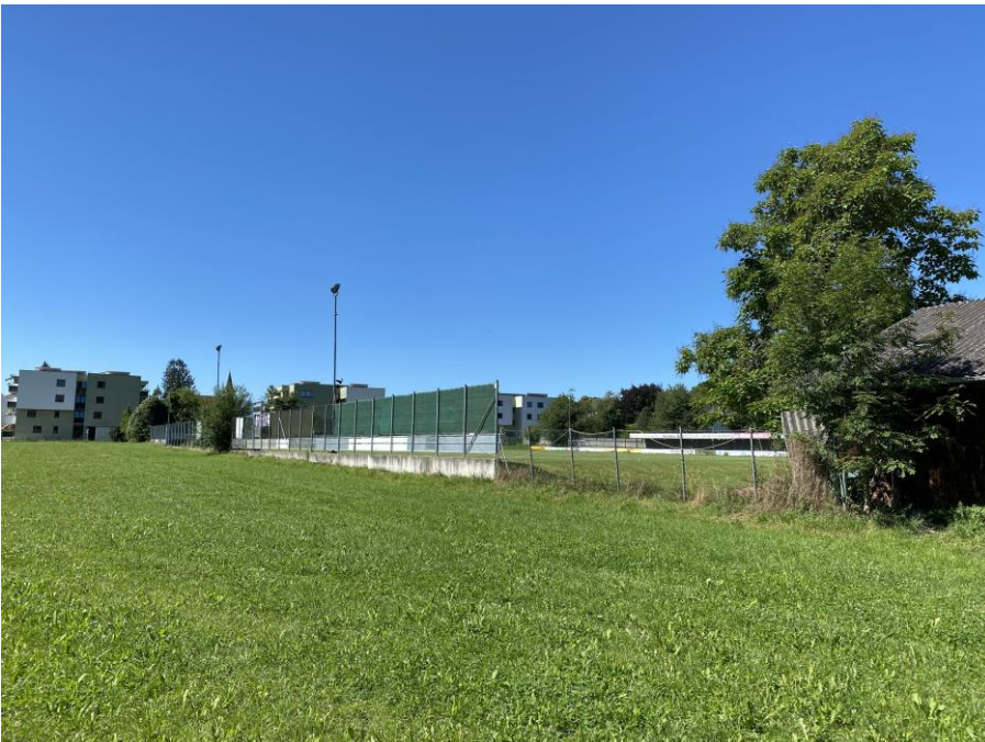
Abb.: Blick auf das Planungsgebiet